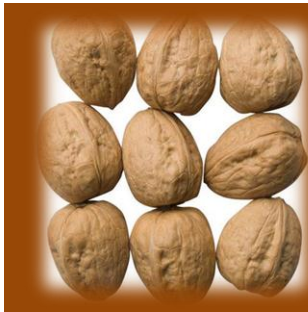
NOCI IN GUSCIO