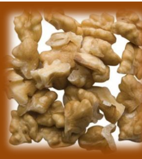
NOCI ROTTE TIPO C