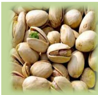
PISTACCHIO IN GUSCIO