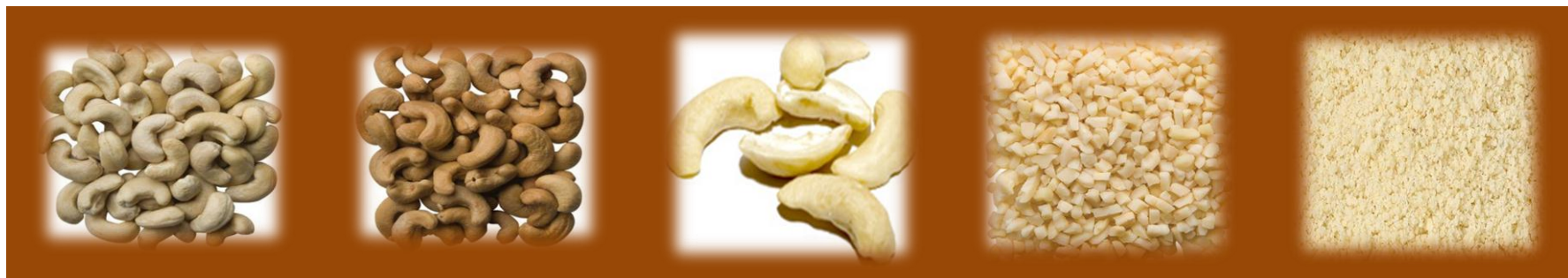
ANACARDIO INTERO LIGHT