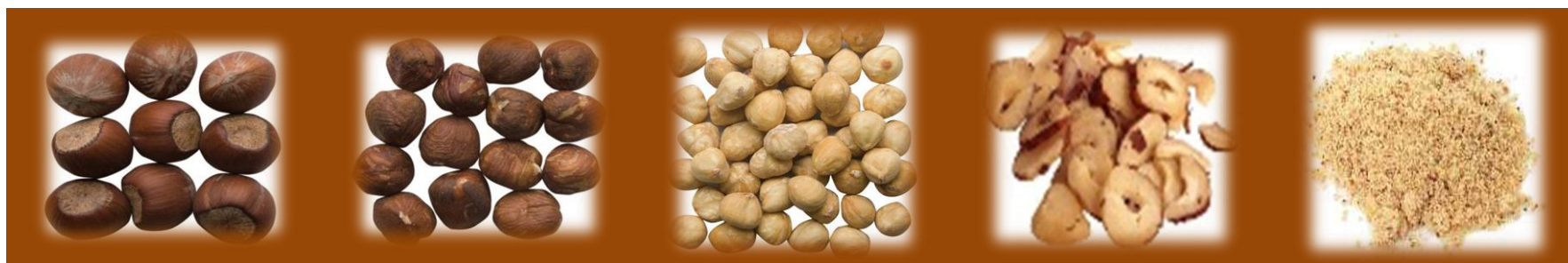
NOCCIOLE IN GUSCIO