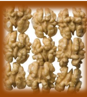
NOCI MEZZE TIPO A