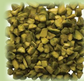
GRANELLA DI PISTACCHIO