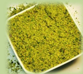
FARINA DI PISTACCHIO