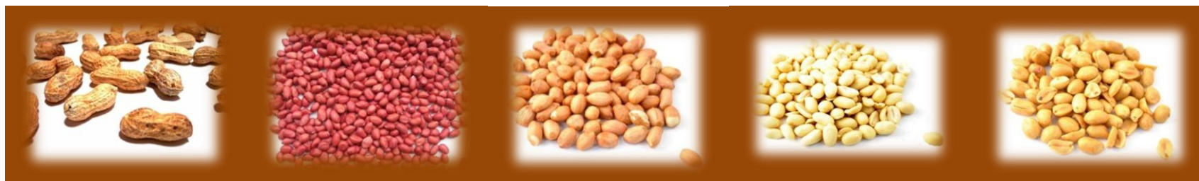
ARACHIDI IN GUSCI