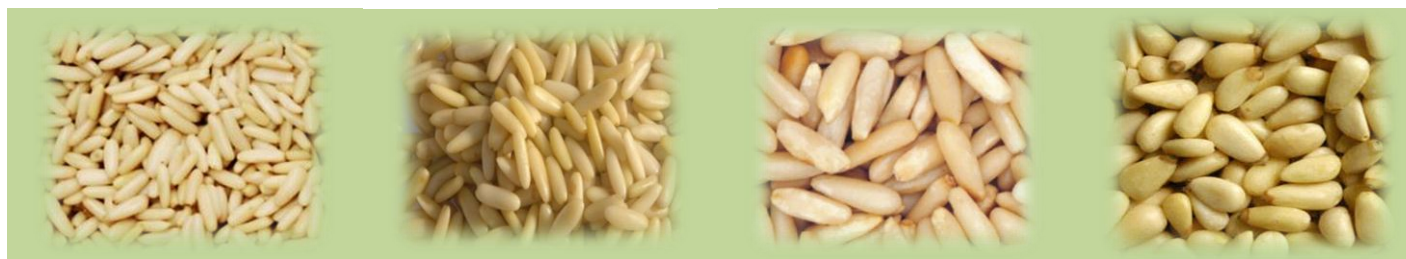
PINOLI NAZIONALI PRIMA SCELTA