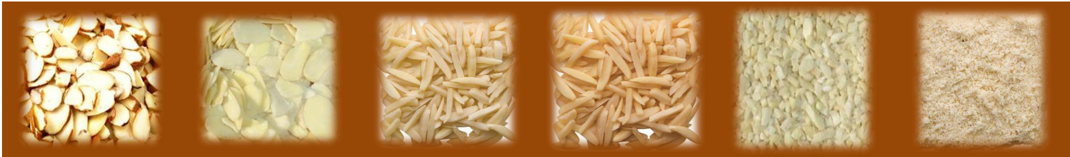
MANDORLE SGUSCIATE AFFETTATE