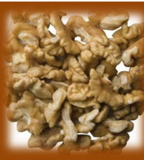
NOCI QUARTE TIPO B