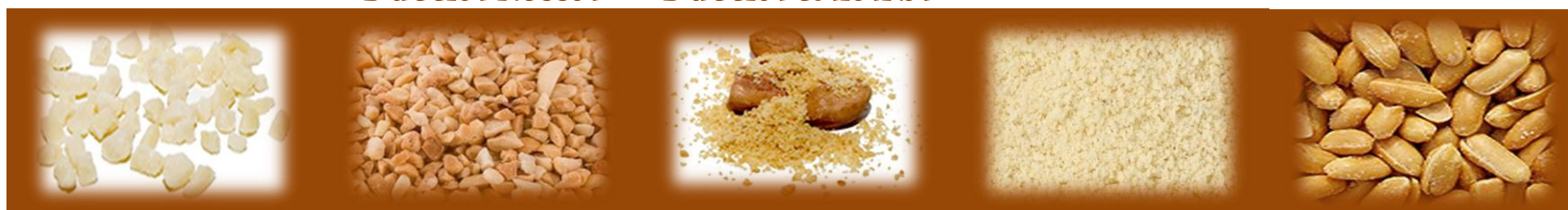
GRANELLA DI ARACHIDI CRUDA